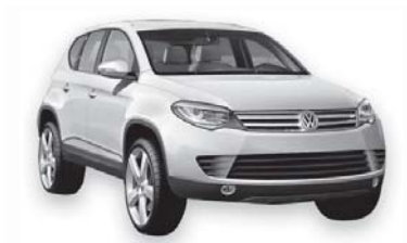
Схема подключения АвтоФон Контрол VW Touareg 2010

ВНИМАНИЕ: Данный модуль сопряжения предназначен исключительно для профессиональной установки. Неквалифицированное вмешательство в штатную электропроводку может привести к выходу из строя блоков электрооборудования автомобиля!